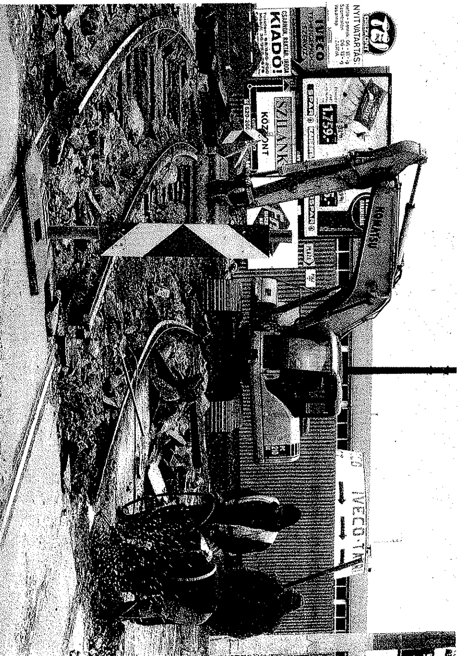
A Pulz utca és a Vásárhelyi Pál utca kereszteződésében is felszedik a síneket.

A két hónapja majdnem teljesen lezárt rókusi csomópontot a jövő hét elejéig a Rókusi körút–Szatymazi utca–Búváró utca–Kossuth Lajos sugárút írvonalon lehet elkerülni. Tegnap reggel felbontották az 1-es villamos vágányait a Pulz utcai kanyarban – órási dugó alakult ki.