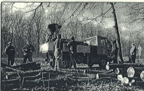
FAKITERMELÉS A VÁROS IATÁRÁBAN.

Tiszaújváros önkormányzatának, a humánszolgáltató központnak és a Városgazda Nonprofit Kft-nek a segítségével több mint száz rászoruló család jut tűzifához a napokban. A segítség a legjobbak érkezett, mert sok család már a bútorait is felaprította, hogy azok eltűzelésével valamitke meleget teremtsen otthonában.