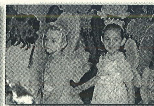
KÉPEINK A KÖVETKEZŐ FARSANGI MULATSÁGOKON KÉSZÜLTEK: A SZÉCHENYI ISKOLA ALSÓSAIÉN, FELSŐSAIÉN, A TÚNDÉRKERT ÓVODÁBAN ÉS A SZEDERKÉNYI ÓVODÁBAN.